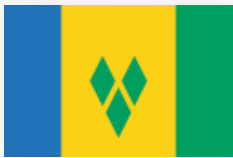
СЕНТ-ВИНСЕНТ И ГРЕНАДИНЫ